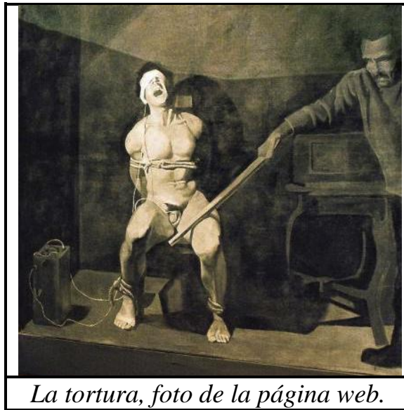
La tortura, foto de la página web.