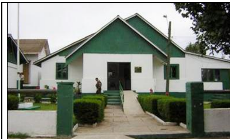
Comiseria de Quintero, foto de la página web.

Fueron amarrados y amordazados, luego trasladados a la Comisaria de Quinteros, allí los juntaron a todos en un calabozo, lo que le permitió, tomar acuerdos, saber sus nombres, mantener la calma y prepararse para lo peor, posteriormente fueron llevados a la Comisaria de Viña del Mar, el 21 de febrero de 1985, nuevamente fueron trasladados a la Comisaria de Quinteros, el grupo completo.