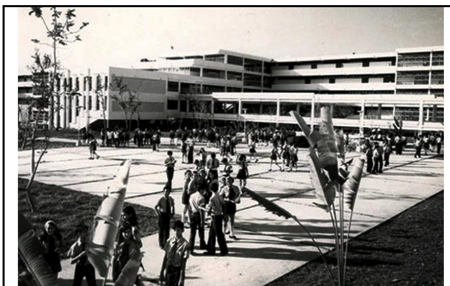
Escuela Al Campo Simón Bolívar, foto de la página web.

Continuando con sus estudios, decidió matricularse, para cursar de séptimo a noveno grado, en la Escuela Al Campo Simón Bolívar ubicada en las proximidades de la capital cubana, experiencia educacional que mezcla el estudio con las labores agrícolas de apoyo a la economía de la Republica de Cuba.