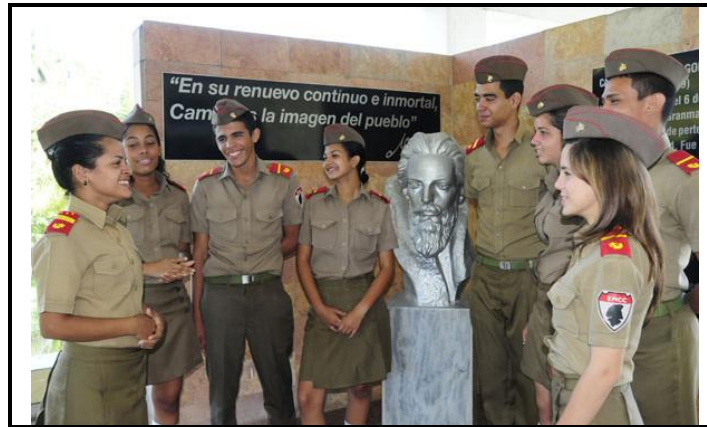
Alumnos de la EMCC