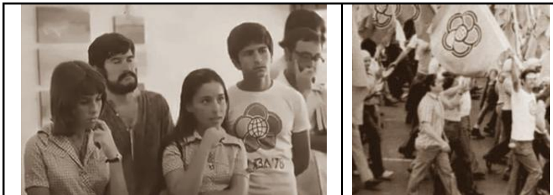
El 28 de julio de 1978, se inauguró el XI Festival Mundial de la Juventud y los Estudiantes, foto de video familiar.

Ese mismo año le tocó integrar la delegación de la Juventud Socialista Salvador Allende (JSSA), que asistió al XI Festival Mundial de la Juventud y los Estudiantes organizado por la Federación Mundial de Juventudes Democráticas y que tuvo lugar en la República de Cuba.