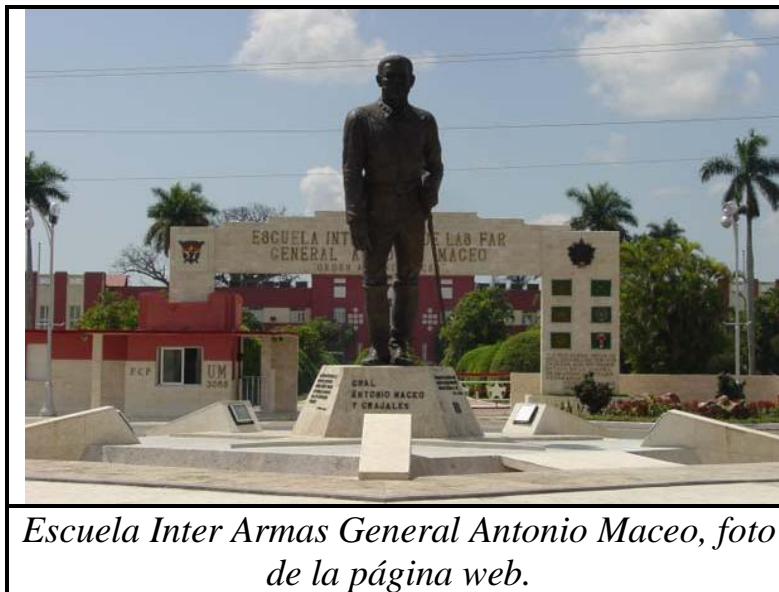
Escuela Inter Armas General Antonio Maceo, foto de la página web.

En sus instalaciones, cientos de jóvenes se forman como oficiales de las FAR en especialidades del perfil de mando e ingeniero de las distintas armas de las tropas terrestres.