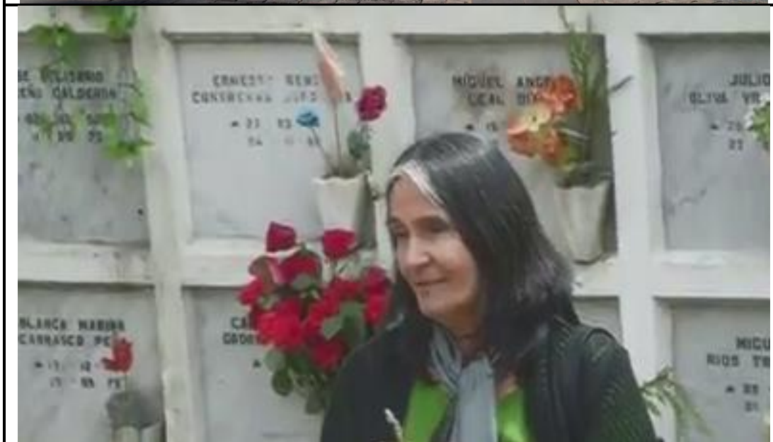
Ubicado en el Patio 102 del Cementerio General de Chile.